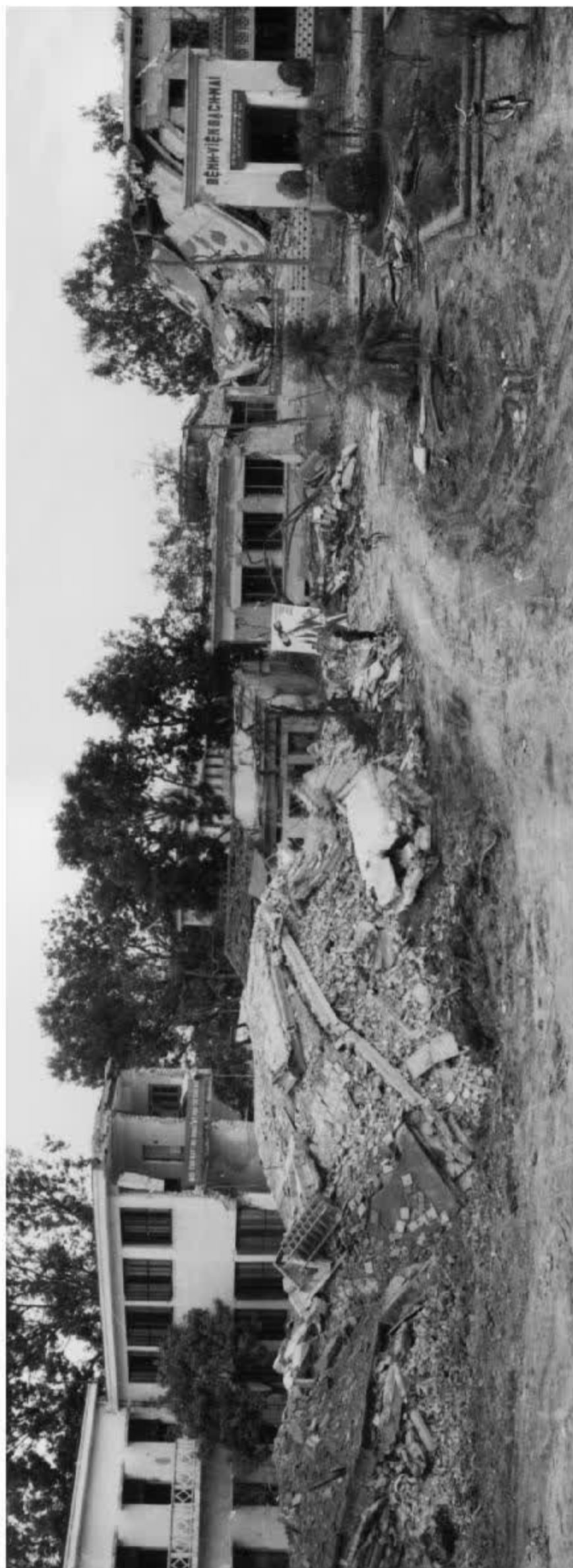
Bom Mĩ huỷ diệt Bệnh viện Bạch Mai, ngày 22-12-1972.