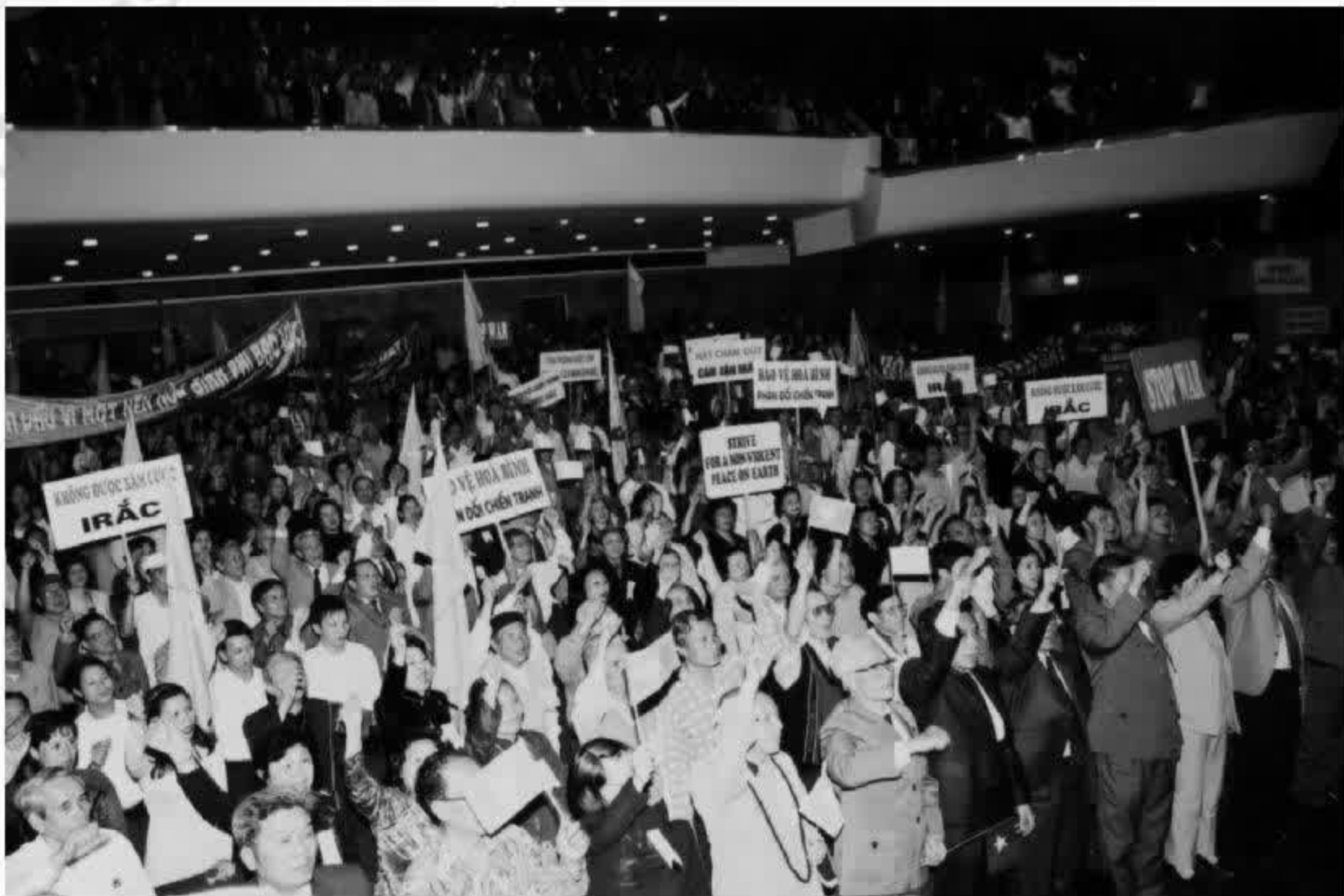
Đại biểu các tầng lớp nhân dân Thủ đô Hà Nội mít tinh phản đối chiến tranh, bảo vệ hoà bình.