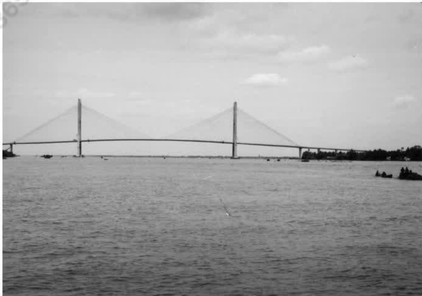
Cầu Mĩ Thuận, biểu tượng của sự hợp tác Việt Nam – Ô-xtrây-li-a.