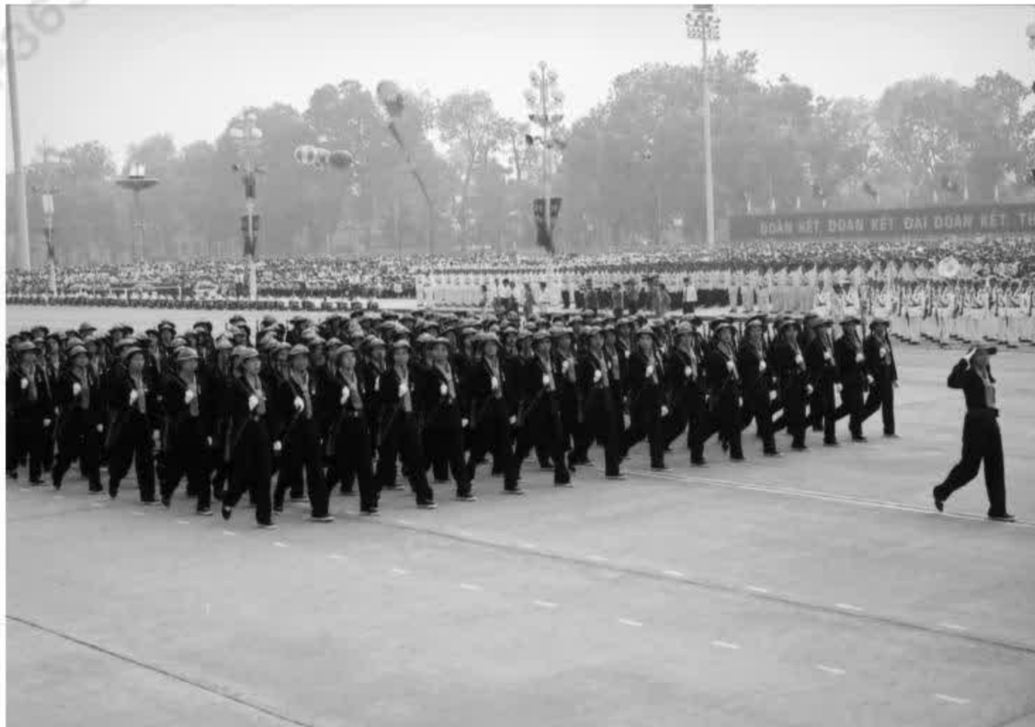
Dân quân nữ Nam Bộ duyệt binh tại Quảng trường Ba Đình, Hà Nội.