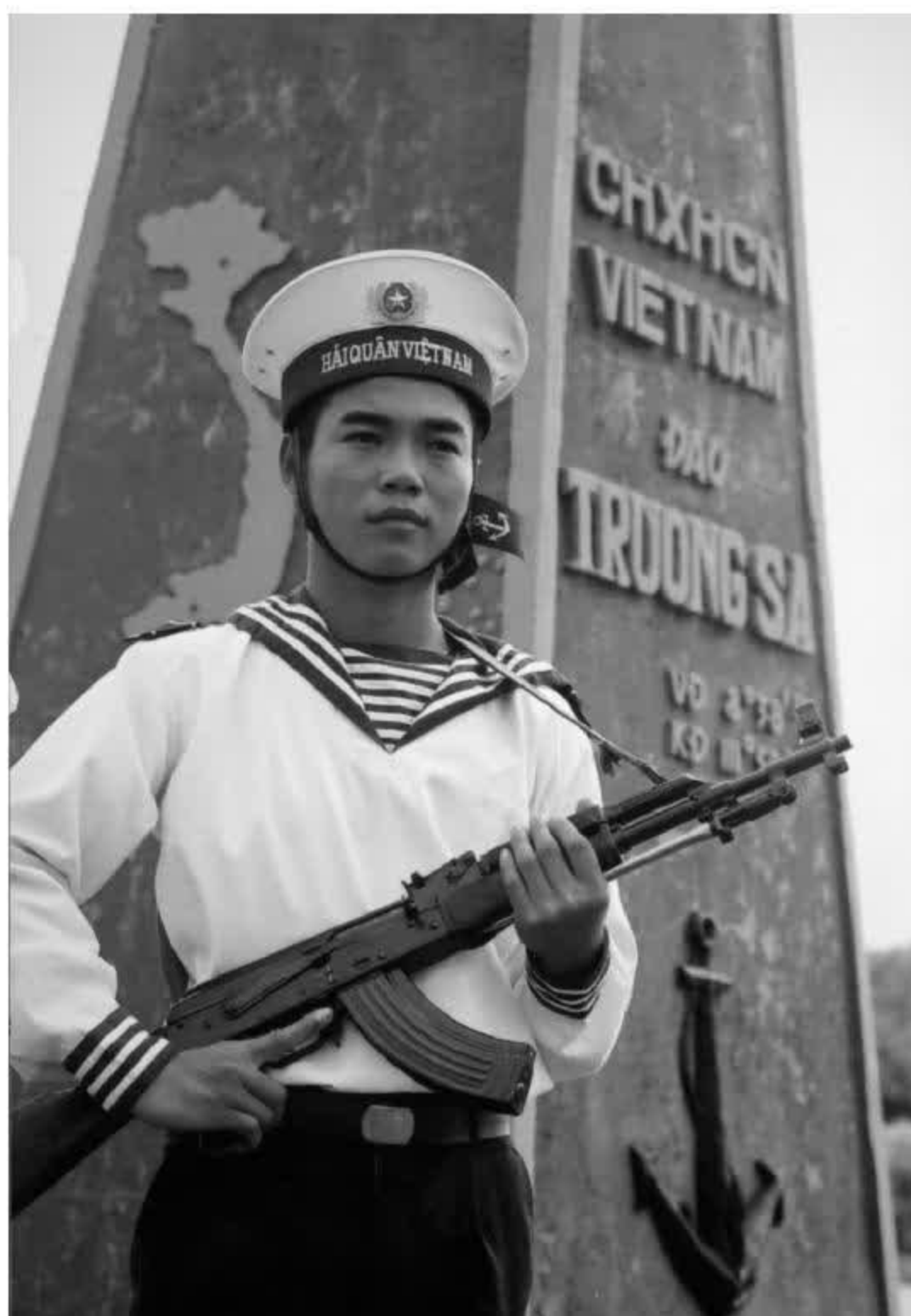
Chiến sĩ hải quân canh giữ đảo Trường Sa Lớn.