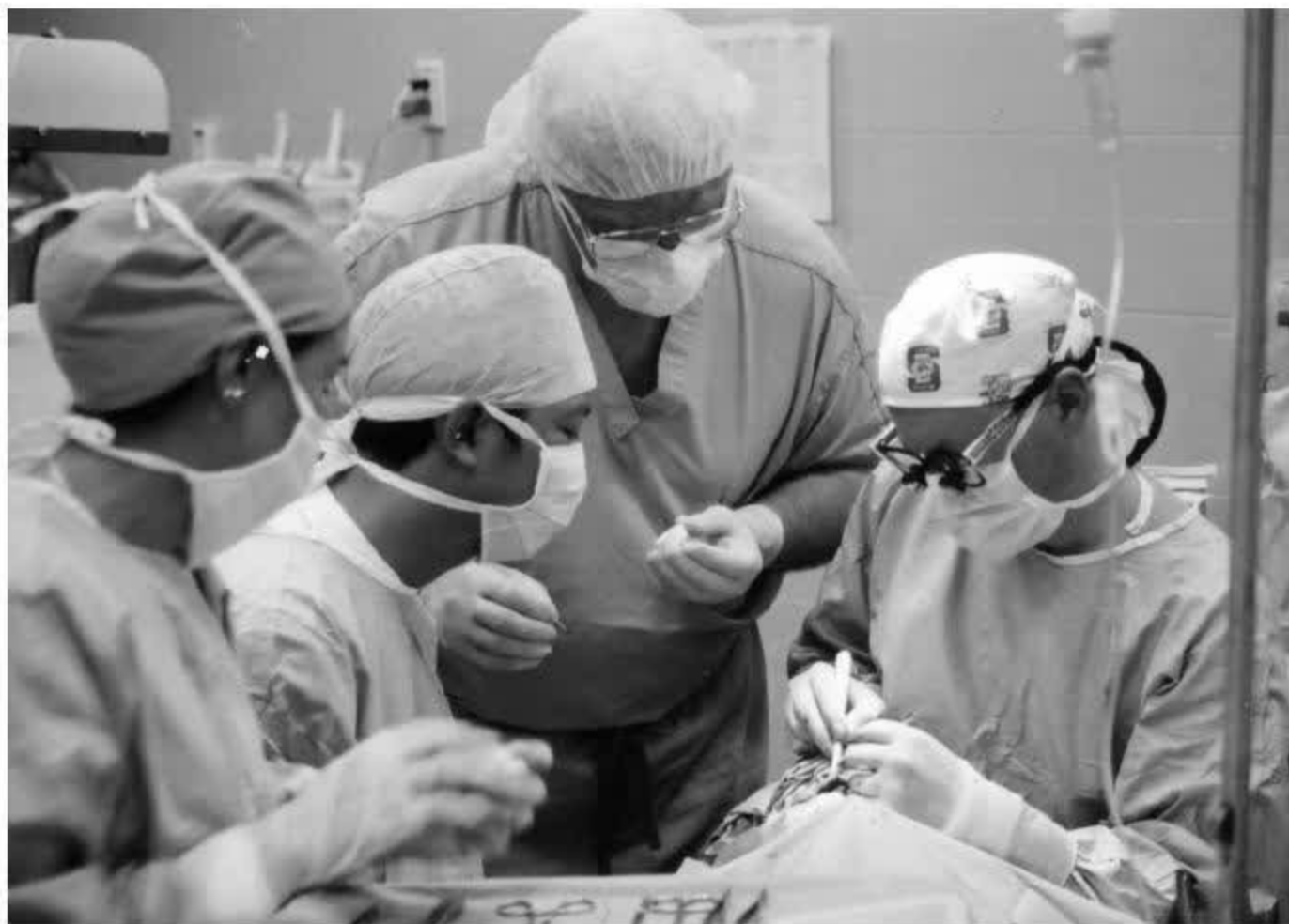
Các bác sĩ Việt Nam và Hoa Kỳ hợp tác tiến hành ca “phẫu thuật nụ cười” cho trẻ em tại bệnh viện Đà Nẵng.