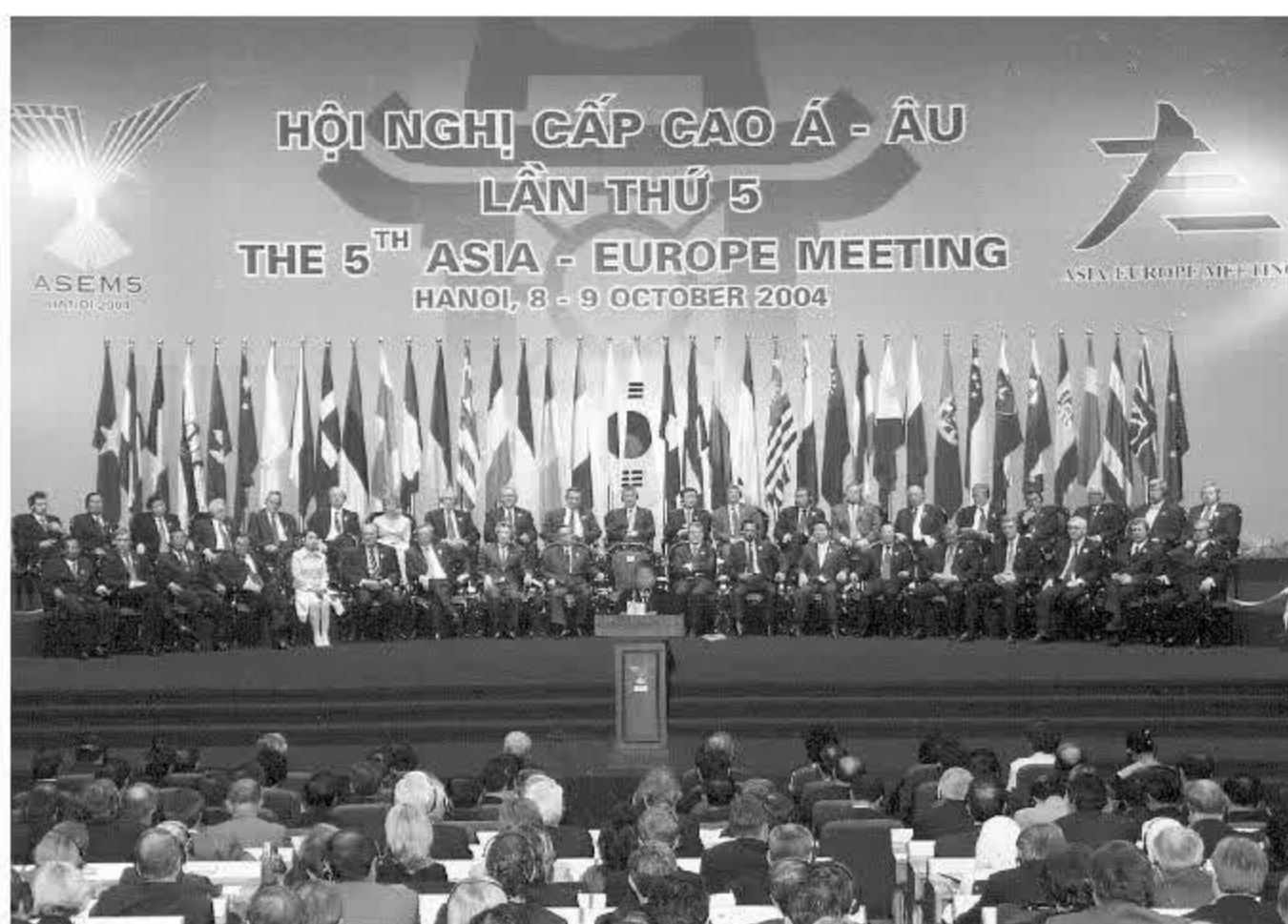
Toàn cảnh Lễ khai mạc Hội nghị cấp cao Á – Âu lần thứ năm (ASEM 5) ngày 8 tháng 10 năm 2004 tại Hội trường Ba Đình, Hà Nội.