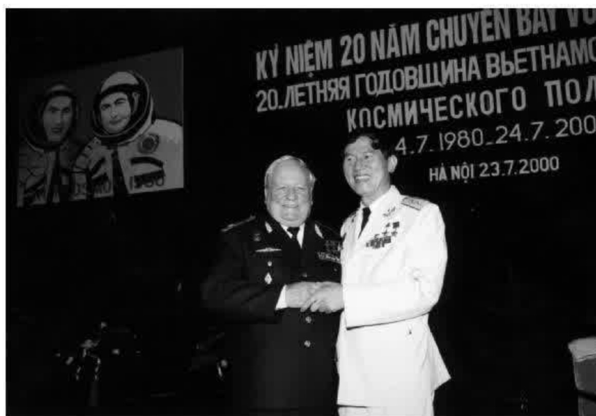
Thiếu tướng – phi công vũ trụ V. V Go-rơ-bát-cô (trái) cùng phi công vũ trụ đầu tiên của Việt Nam – Trung tướng Phạm Tuân trong buổi mít tinh kỷ niệm 20 năm chuyến bay vũ trụ hợp tác Việt – Xô.